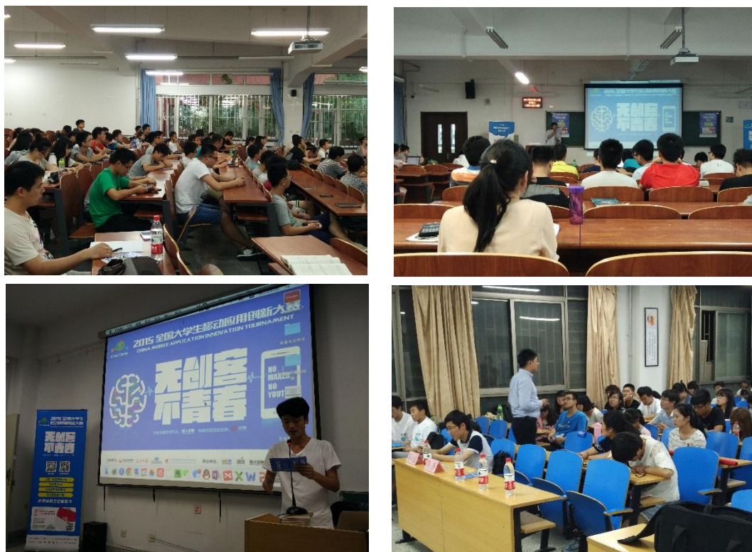
创业主题宣讲会现场照片