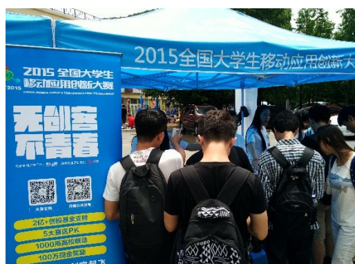
校园宣传活动现场照片

“百校行”活动在高校老师和学生团体的支持下分别在大连理工大学、洛阳理工学院、中北大学、西北师范大学四所高校开展了创业主题宣讲。宣讲会现场邀请到移动互联网行业领军人物、技术专家、职业规划专家为学生分享创业心得、创业领域前沿信息以及职业规划等知识，并与现场学生开展互动讨论，受到学生的热烈欢迎，还现场指导一批有创业梦想的大学生创客找到发展的方向。